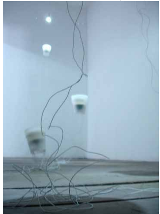
Li Wenhui, Le Jardin , 2010

Tremblements, ondulations des fréquences, jusqu'à la vibration des objets qui prennent vie pour proposer une véritable symphonie urbaine.