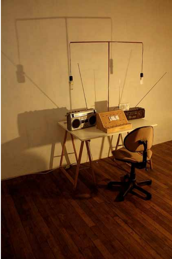
Valentin Ferré, Hauntology , 2010