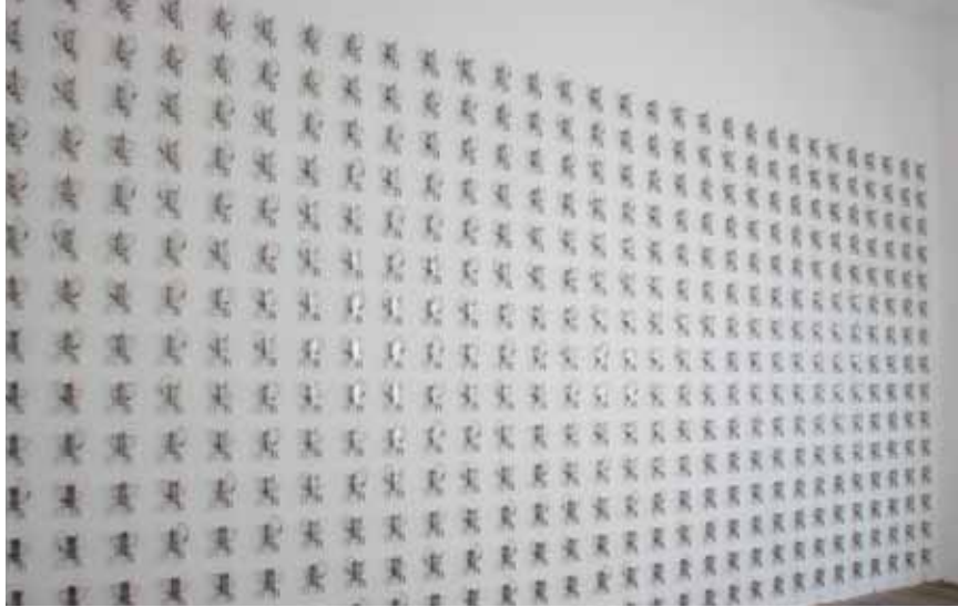
Pe Lang & Zimoun, Untitled Sound Objects , Bon Accueil, 2008 Installation sonore : 450 pendules électro-magnétiques.