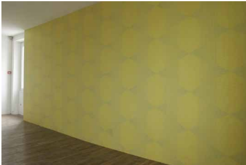
Sébastien Roux / Cocktail Designers, Wallpaper Music , Bon Accueil 2009 Installation sonore : papier peint, vibroglass, bande sonore