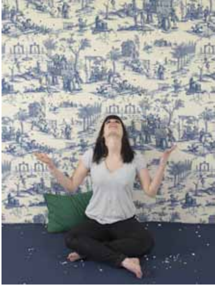
Alexandra Brillant, Leitmotiv , 2012

La photographie est avant tout pour Alexandra Brillant un espace de mise en scène. Un espace cadré, qui parfois cloître, voire emprisonne. Leitmotiv est une série de photographies grand format, où les personnages hallucinés s'activent dans des tâches répétitives, absurdes et destructrices. Prisonniers du décor, ils en deviennent les motifs.