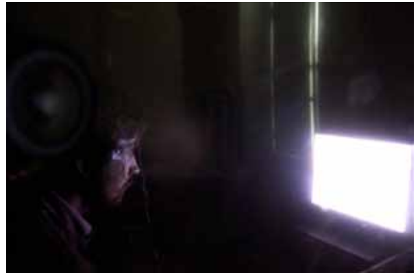
Alexandra Brillant, Vue de l'esprit , 2012