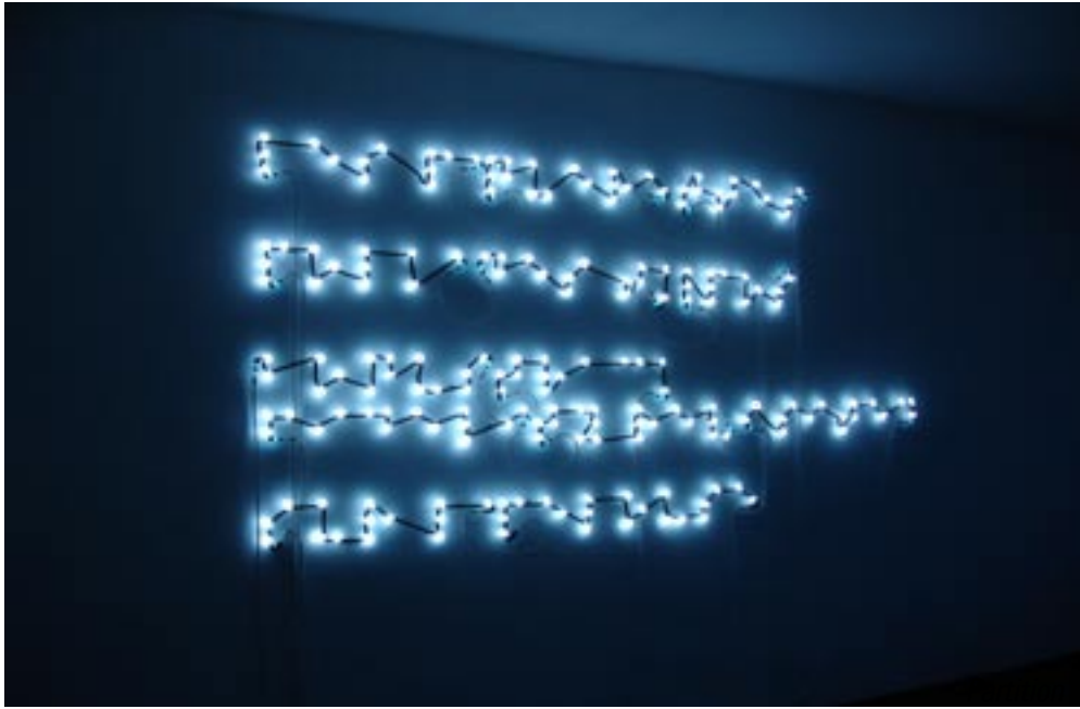
Les paquerettes / Polka des typos / Bonus Track : Fidelity Revisited / Sur la pelouse 4 titres, néons, 12 partitions de musique de bal du Fond Elie Dupeyrat (Archives départementales de la Dordogne) ré-échantillonnées par ordinateur., 48min, 12 morceaux