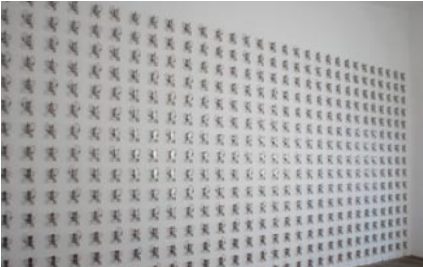
Pe Lang & Zimoun, Untitled Sound Objects, Bon Accueil, 2008 Installation sonore : 450 pendules électro-magnétiques.