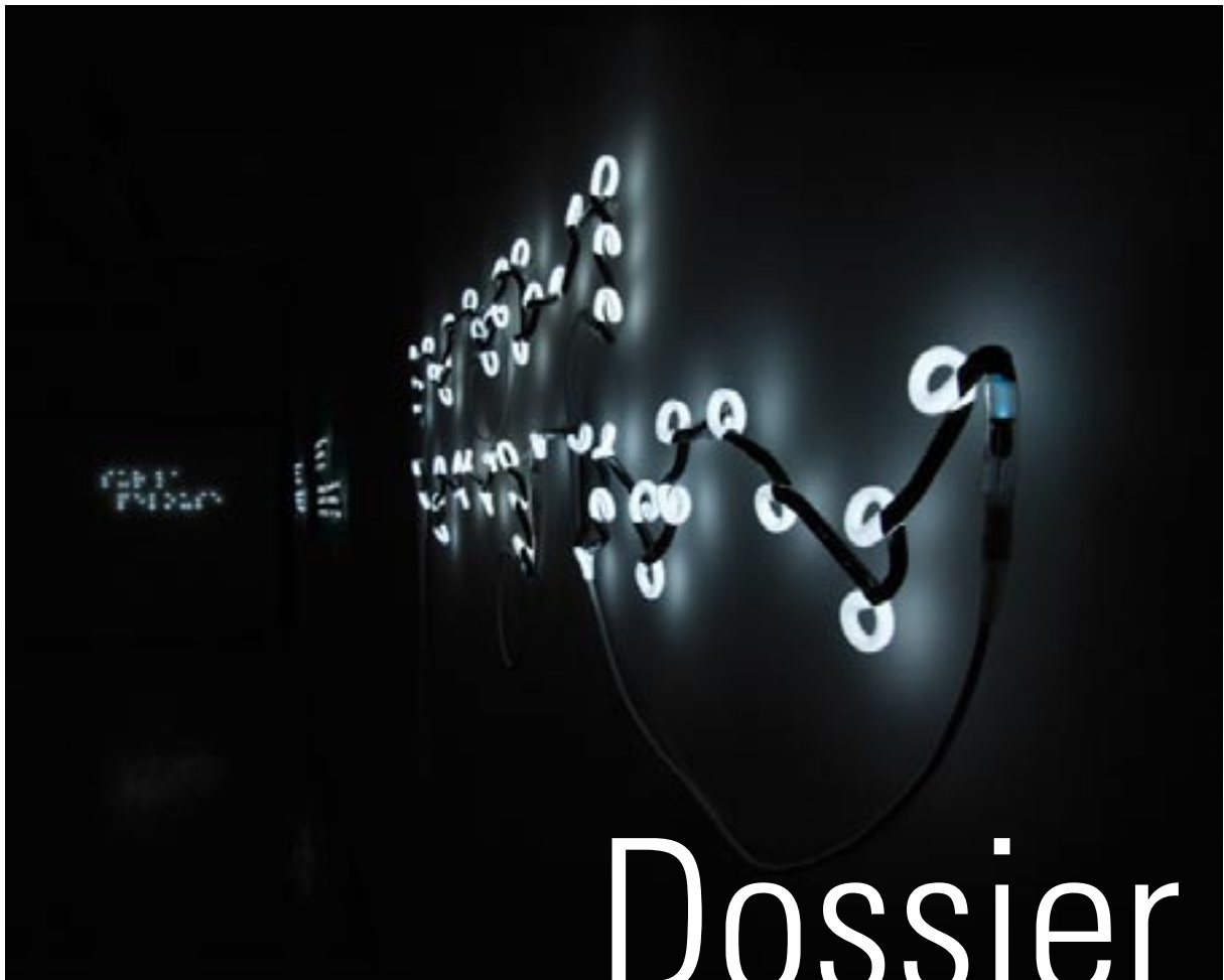
Partition, Julie Morel, 2010