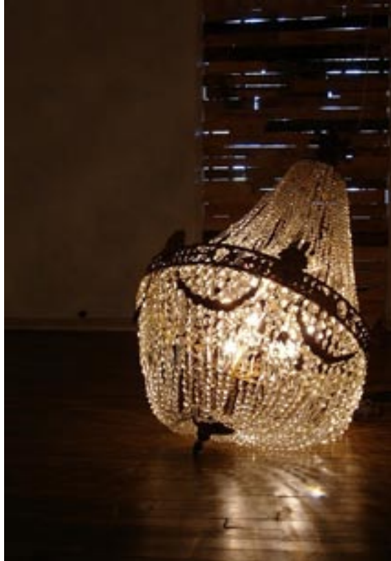
Exposition Licht / Klang - Lüster , Tilman Küntzel , lustre