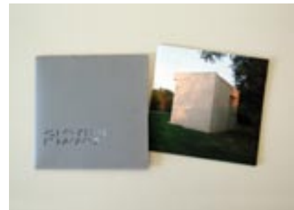
Partition. 48min, 12 morceaux, CD tiré à 300 exemplaires