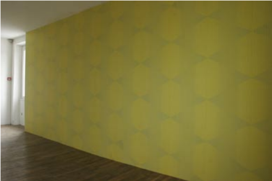
Sébastien Roux / Cocktail Designers, Wallpaper Music, Bon Accueil 2009 Installation sonore : papier peint, vibroglass, bande sonore