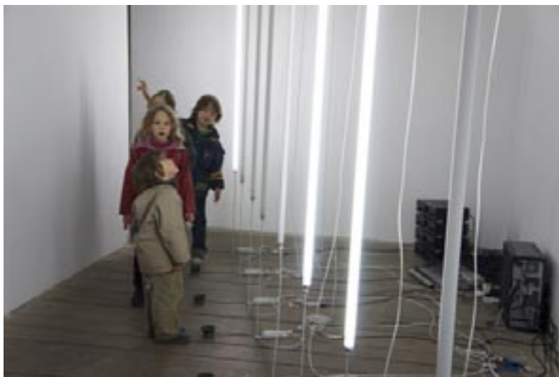
Exposition Licht / Klang - 8 Bit , Michael Aschauer - Néon Atelier de médiation