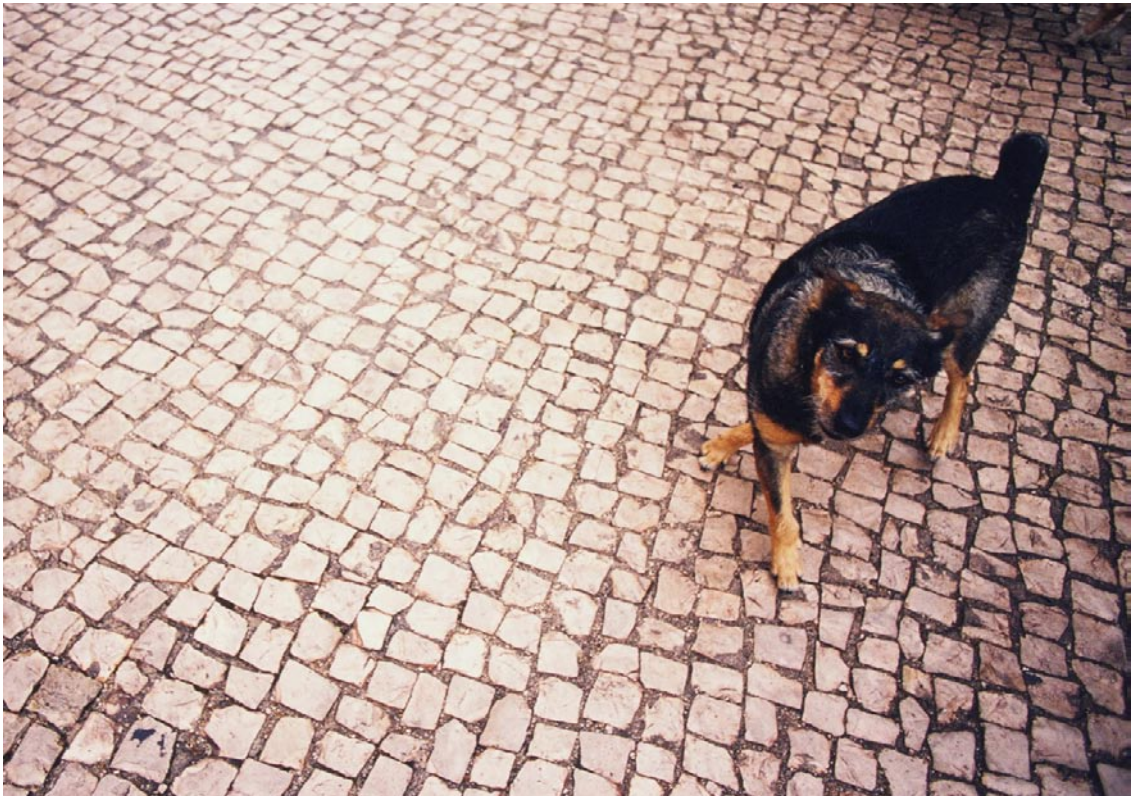
Série Natalia , Lisbonne. Extrait