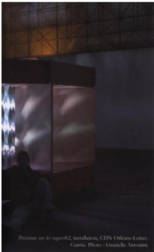
Précisions sur les vagues #2, installation, CDN Orléans-Loiret-Centre.

d'un paysage (craquements de branchages et cours d'eau dans Merveilles ), mais ailleurs, il agira comme un puissant facteur d'abstraction tenant à distance un réel trop prévisible (les raz-de-marée de foule préférés au son de la mer dans Précisions sur les vagues #2 ).